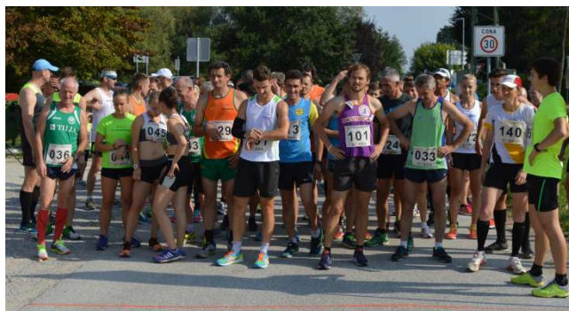
Pred startom 31. kostanjeviškega teka, september 2016

Prireditev šteje za Dolenjski pokal v rekreativnih tekih in za pokal Občine Kostanjevica. Proga je dolga 9 km. Start in cilj teka je pri Osnovni šoli Jožeta Gorjupa, Kostanjevica.