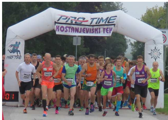
start 33. kostanjeviškega teka, september 2018

Proga je dolga 9 km. Start in cilj teka je pri Osnovni šoli Jožeta Gorjupa, Kostanjevica.