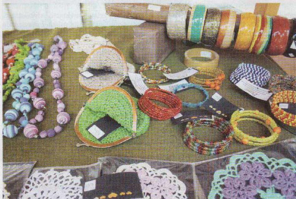
Na tržnico med žive barve

Tržnica, v Brežicah recimo, kjer sem »pohajkoval« tega dne, je torej v nekem svojem delu romantika. Ima pa tudi drugo plat. Na brežiško tržnico na stranišče zahaja meščan. Stranišče uporabi na način, da trpi javna hi-