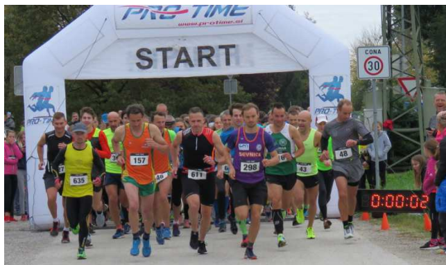
start 32. kostanjeviškega teka, oktober 2017

Proga je dolga 9 km. Start in cilj teka je pri Osnovni šoli Jožeta Gorjupa, Kostanjevica.